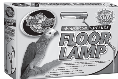
AvianSun Floor Lamp Item # AFL-10E